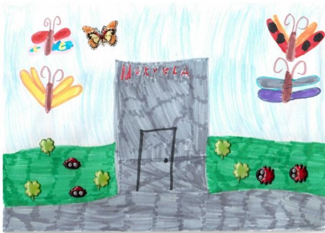
Iliustravo Jurinta Pranckūnaitė, 3 e klasė